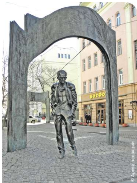
На Арбате есть памятники и Булату Окуджаве, и Александру Пушкину с молодой женой Натальей Николаевной, а мозаика Павла Корина «Орден Победы» украшает вестибюль станции метро «Смоленская»

Эта выставка заинтересует не только взрослую публику, но и детей. Она отсылает посетителя в прошлое, позволяет сравнить его с настоящим, а экспонаты рассказывают подлинную историю Арбата.