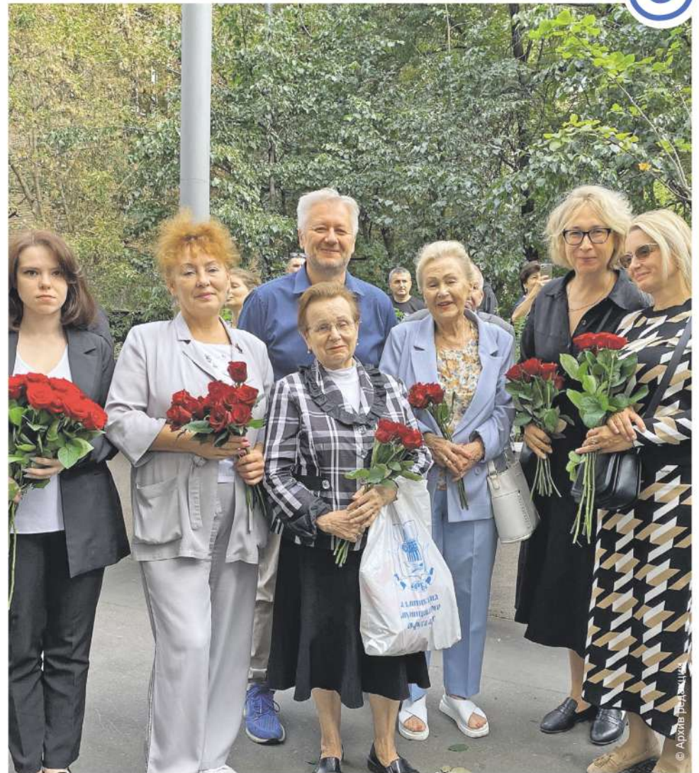
Присутствовавшие на открытии мемориальной доски отмечали, что у мраморного Ланового очень хорошая, живая улыбка. Оказывается, это было единственное поже-