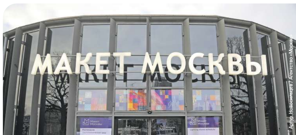
Артур Новосильцев / Агентство «Москва»

Посетить павильон и воспользоваться его услугами можно бесплатно.