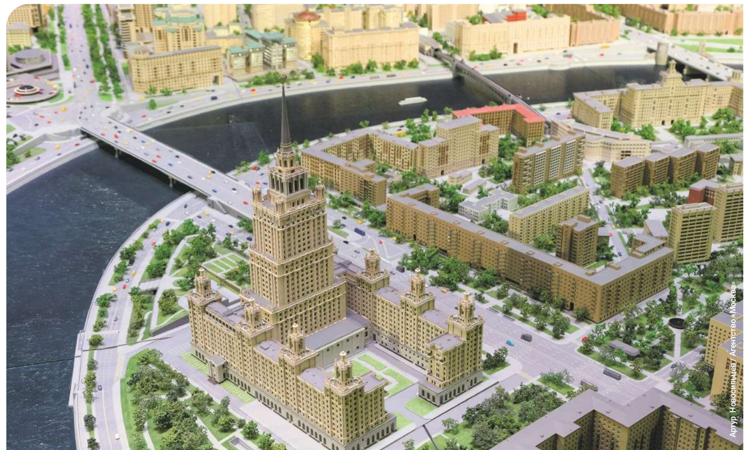
Артур Новосильцев / Агентство «Москва»

Хорошо видны облицовка стен, оконные переплёты, наличники и карнизы. Воссозданы даже мозаика и барельефы