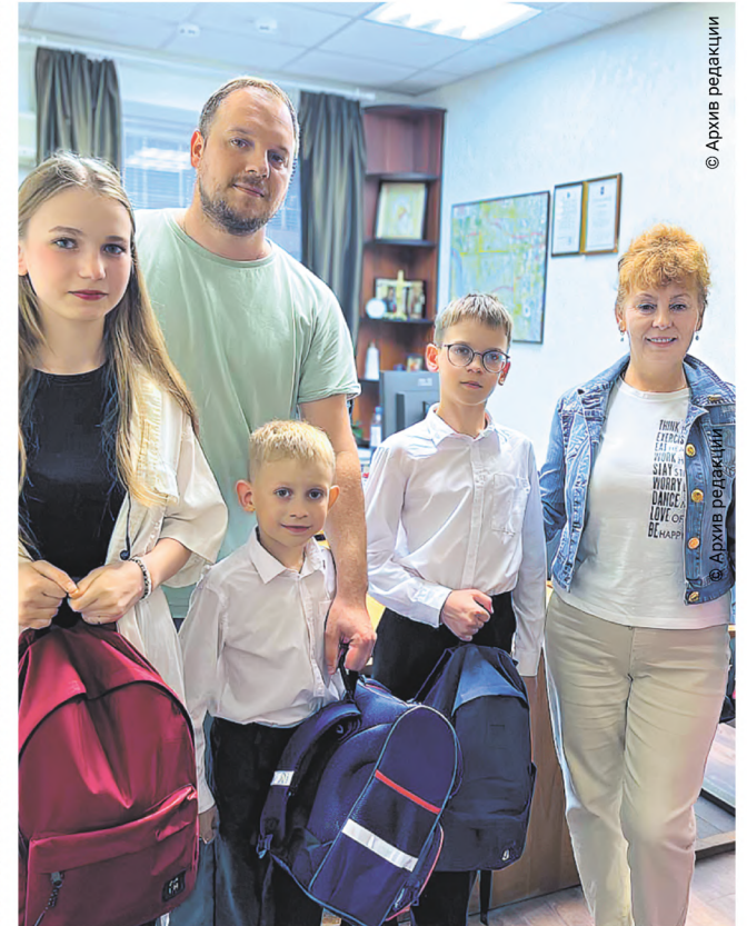
Арбатских школьников поздравили с Днём знаний и вручили ранцы со всем необходимым для занятий.